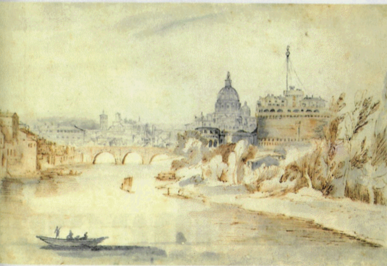
Jan Brueghel, Zicht op Rome , Hessisches Landesmuseum, Darmstadt, Duitsland