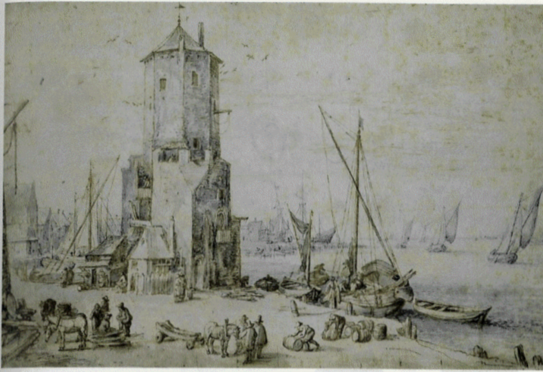
Jan Brueghel, Harbor with Tower , Graphische Sammlung im Städelschen Kunstinstitut Frankfurt, Duitsland