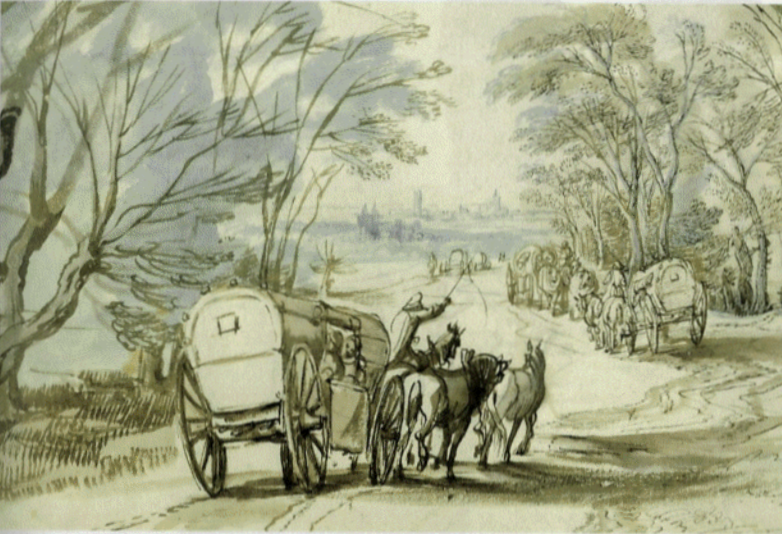
Jan Brueghel, Een koets aan de rand van het bos