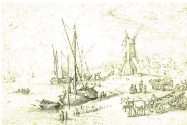
Jan Brueghel, Landschap met molen aan een rivieroever , tekening, Amsterdam, Rijksmuseum

Onder hun invloed experimenteerde Jan Brueghel met overvolle, nauwelijks te ontwarren laatmaniëristische composities, maar dat was slechts een overgangsfase in zijn artistieke ontwikkeling. Ook belangrijk tijdens die Italiaanse jaren waren zijn vaders tekeningen van boslandschappen en de inspiratie die hij putte uit de observatie van het dagelijkse leven in en rond Rome en Tivoli.